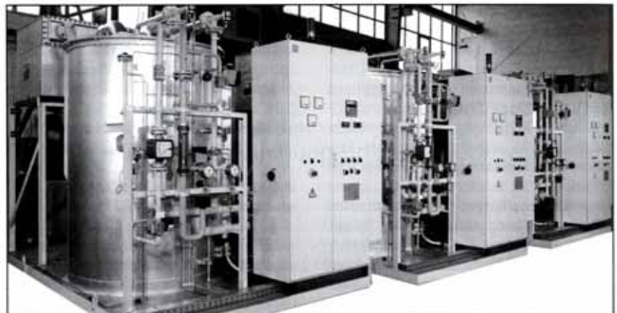
Leistungsstarke und wirtschaftliche Endogasgeneratoren der Gebrüder Hammer GmbH

Gebrüder Hammer GmbH Postfach 10.11.46 D - 63265 Dreieich Telefon: +49 06103 40370 - 0 Telefax: +49 06103 40370 - 10 E-Mail: info@hammer-gmbh.de Internet: www.hammer-gmbh.de