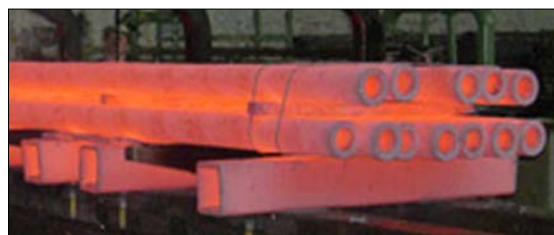
Abbildung: Glühende Stahlrohre

Der weltweit führende Hersteller für nahtlose, warmgewalzte Stahlrohre aller Art, V & M TUBES, hatte im August 2005 ein Schutzgasversorgungssystem mit einer Leistung von 250 Nm 3 /h bei der Gebrüder Hammer GmbH in Auftrag gegeben, welches bereits erfolgreich in Betrieb genommen wurde. Dieses Jahr folgte die Bestellung eines baugleichen, zweiten Schutzgasversorgungssystems. Das Werk in Mülheim an der Ruhr gehört zu den leistungsfähigsten Stahlrohrwerken der Welt. Darüber hinaus wurde eine Option auf ein zusätzliches, drittes Schutzgasversorgungssystem vereinbart.