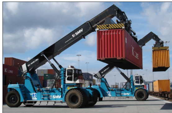
Abbildung: Sogenannte „Liftrucks“ der Konecranes

Die Konecranes AG ist ein weltweit führender Anbieter von Kransystemen und Fördertechniken mit Sitz in Finnland. Zur Herstellung von Industriekränen, Schiffs- und Hafenkranen sowie von Förderkranfahrzeugen werden vergütete und gehärtete Antriebskomponenten verbaut.